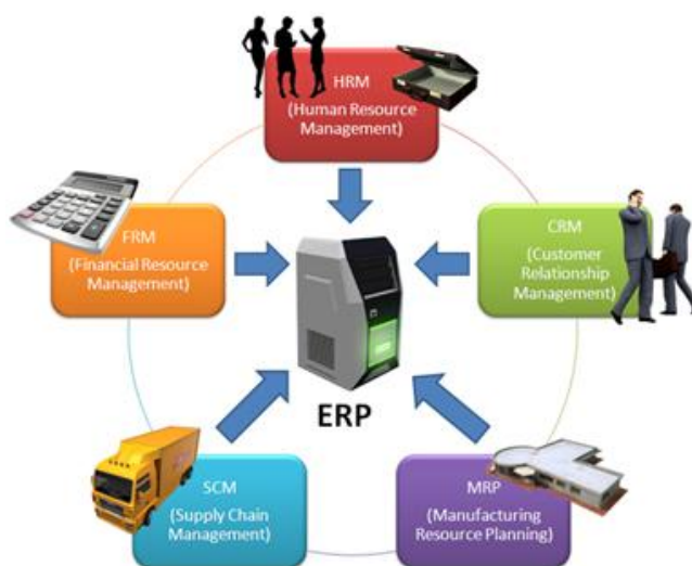
Figura 3 - Estrutura ERP

Trata-se, pois, de uma arquitetura de software que facilita o fluxo de informação entre todas as funções dentro de uma empresa (Fig. 3). O ERP automatiza os processos de uma empresa, com a meta de integrar as informações através da organização, eliminando interfaces complexas e caras entre sistemas não projetados para conversarem. Desta forma, todos os processos de uma organização são colocados dentro de um mesmo sistema e num mesmo ambiente.