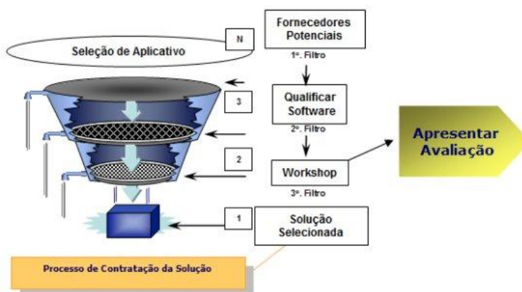
Figura 3 - Seleção da solução ERP

A primeira fase, conceive , constitui-se da concepção da etapa de implementação. Faz-se o levantamento dos processos das áreas envolvidas com o ERP (esse procedimento é conhecido como “AS-IS”), buscando uma visão de alto nível dos processos de negócio. Após esse levantamento, elabora-se um desenho do modelo de processos futuros (“TO-BE”), que irá direcionar a configuração do novo sistema (fig. 3).