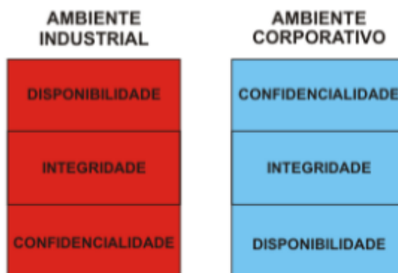
Figura 2 - Prioridades nos ambientes industrial e corporativo

A integração do ambiente industrial e o corporativo é um fato, porém, possuem características individuais. O ambiente industrial tem como prioridade a produção e a segurança humana, já o ambiente corporativo prioriza o desempenho e a integridade dos dados (Figura 2).